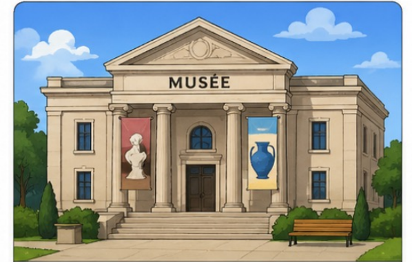
le musée (the museum)