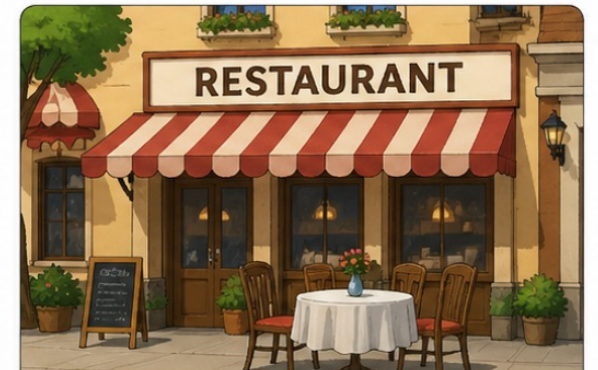
le restaurant (restaurant)