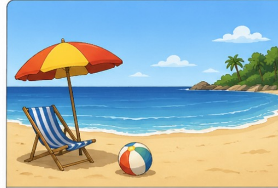
la plage (beach)