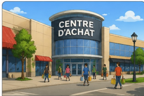
le centre d'achat (shopping center/mall)